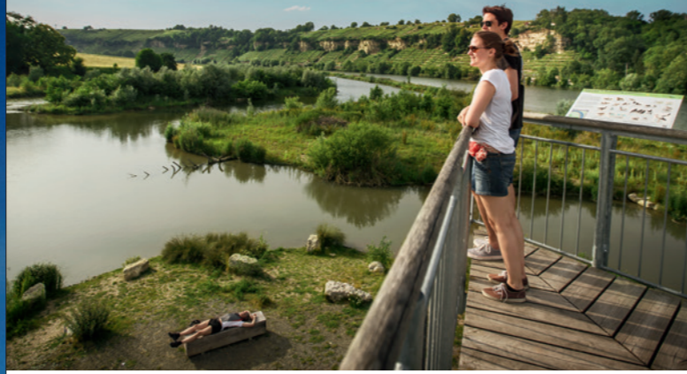
▲ 2008 // Zugwiesen, Ludwigsburg

Der Landschaftspark Region Stuttgart ist seit 2005 das Instrument, mit dem der Verband Region Stuttgart, gemeinsam mit den Kommunen, Natur und Landschaft durch konkrete Maßnahmen gezielt aufwertet und weiterentwickelt