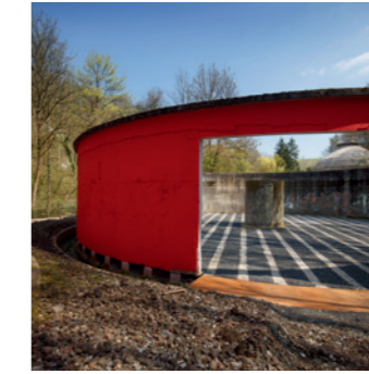
▲ 2013 // Natur-Kunst-Räume Weidachtal, Fellbach