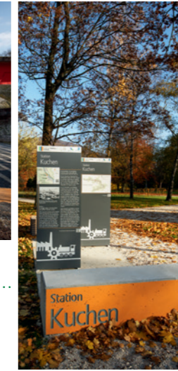
▶ 2015 // Route der Industriekultur, Filstal