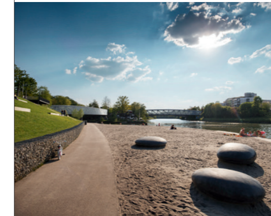
◀ 2012 // Neckarstrand, Remseck am Neckar