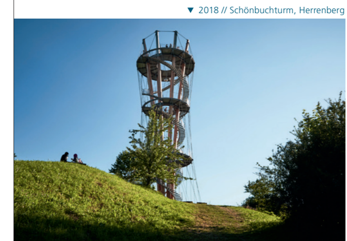
▼ 2018 // Schönbuchturm, Herrenberg