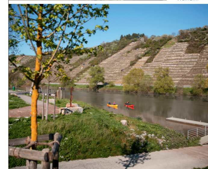
▼ 2010 // Neckarwiese, Walheim